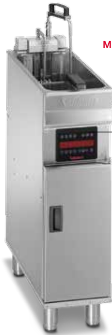
MODELL EVO250 COMPUTER